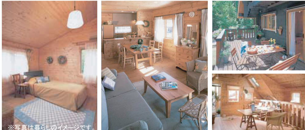
開放感たっぷりの吹抜けや、大屋根の高い天井、空を眺める天窓つきの個室など、遊び心たっぷりの伸びやかな空間をぜひ実際にご体感ください。