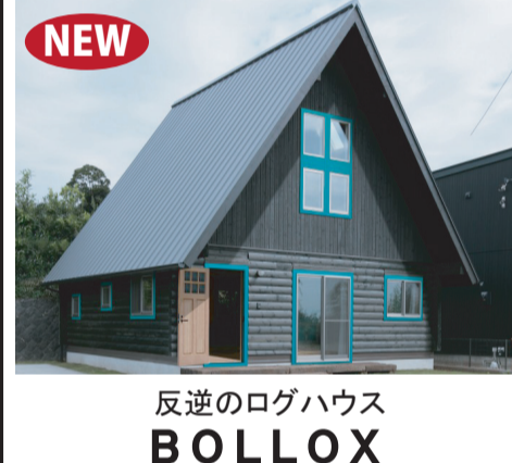
反逆のログハウス BOLLOX