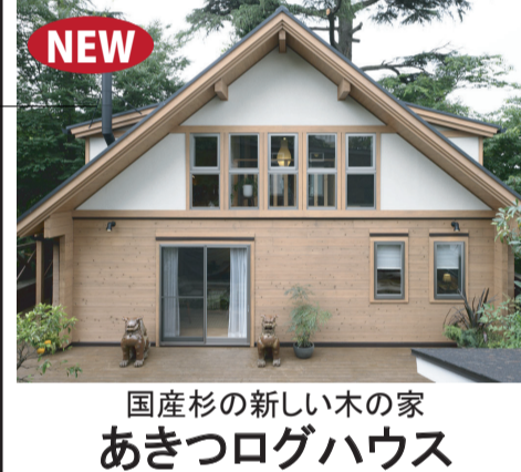
国産杉の新しい木の家 あきつログハウス